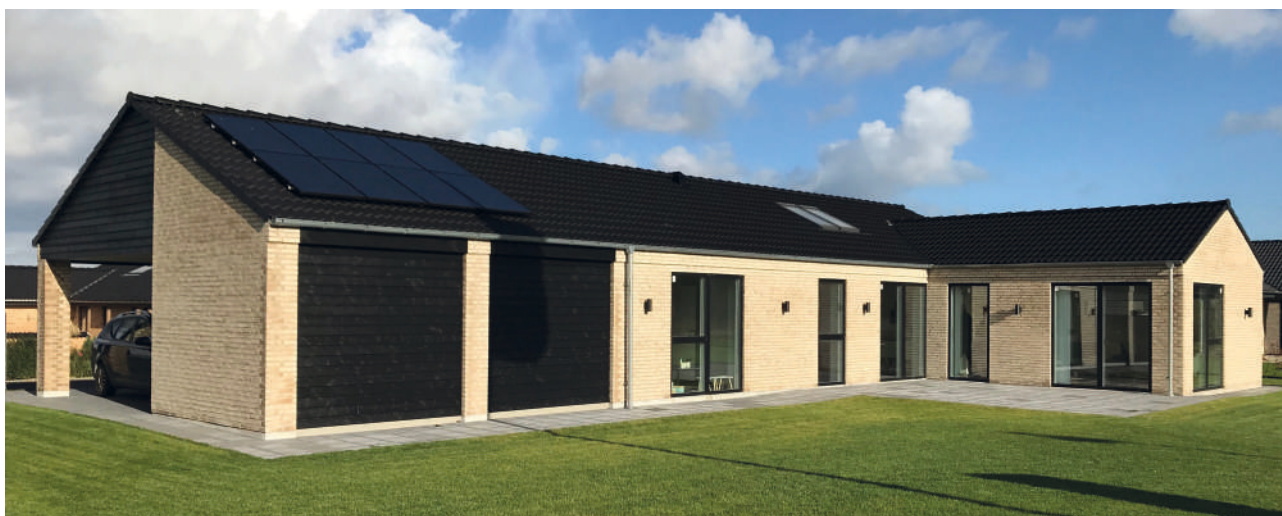
Typisk typehus opført til lavenergiklasse 2015.

Den frivillige bæredygtighedsklasse sætter ambitiøse krav fra 2021. Stat, kommuner og private bygherrer anvender disse i udbud og ved udvikling af lokalplaner.