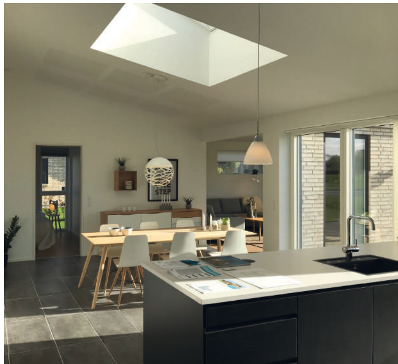
Krav til materialer og energi skal balanceres med indeklimaet.

Bæredygtighedsklassen skal sætte krav til maksimalt CO 2 -udledning i alle faser af nybyggeriet. Kravet sættes til 8,5 kg CO 2 /m 2 /år fra 2021 og skærpes i 2023, 2025 og 2030.