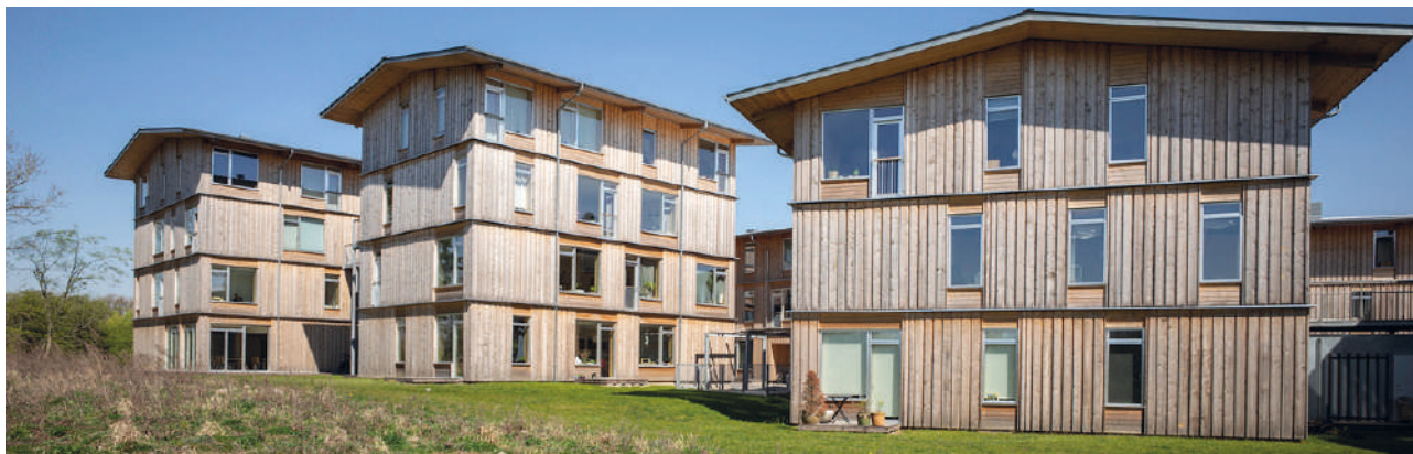
Projekt: FBAB Lisbjerg for AI2bolig. Arkitekt: Vandkunsten.