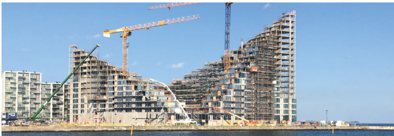
Etageboligbyggeri på Aarhus havn.