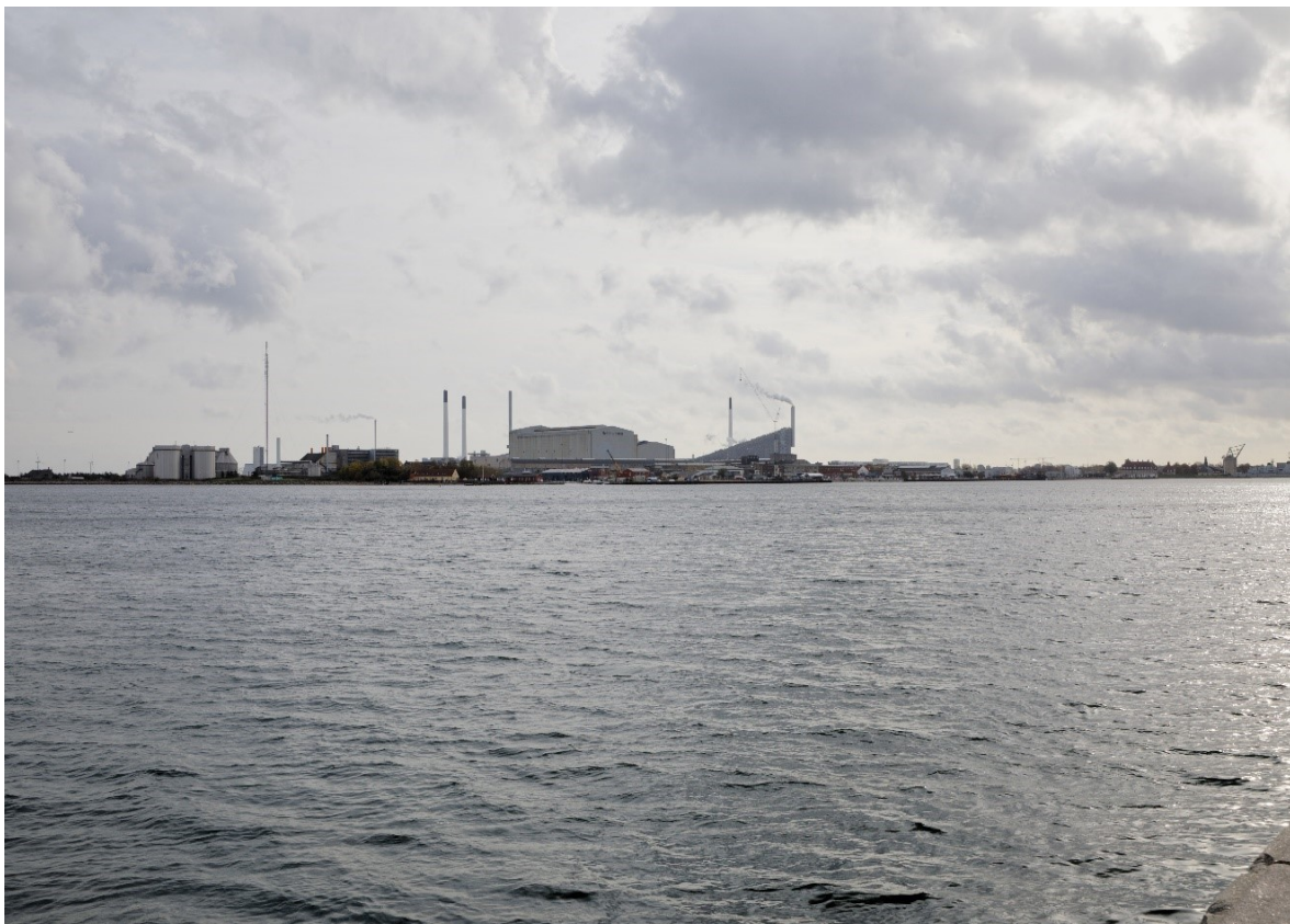
Fotostandpunkt 3 - eksisterende forhold og 0-alternativet set fra Langelinie mod Refshaleøen. 0-alternativet er tilsvarende de eksisterende forhold, da hverken Nordhavn eller Lynetteholm kan ses fra fotostandpunktet. 0-alternativet viser udsynet fra fotostandpunktet, hvis planen ikke gennemføres.