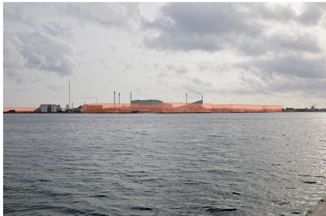
Fotostandpunkt 3 – fremtidige forhold set fra Langelinie. Renseanlægget Lynetten er ikke byudviklet.