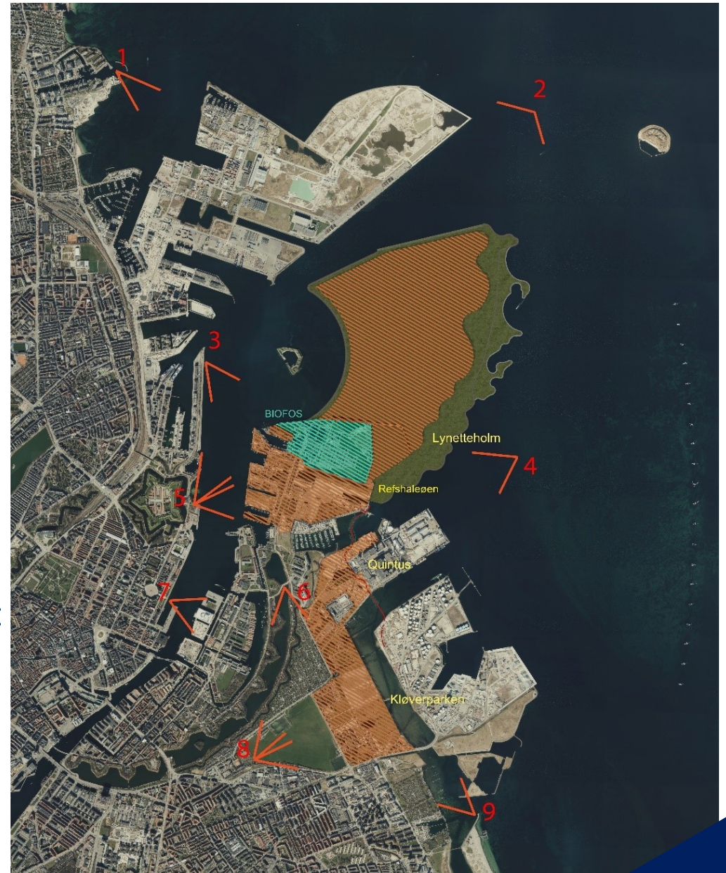
Kortet viser de udvalgte fotostandpunkter, hvorfra planelementet byudviklingsområder er skitseret.