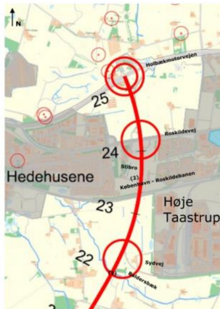
Figur 4-3: Tilslutningsanlæg og forbindelsesanlæg ved Høje Taastrup.

Hertil kommer tilslutningen til Holbækmotorvejen i km 25 (Vejteknisk rapport side 23 og 30) og TSA nord for Holbækvejen i km 27.