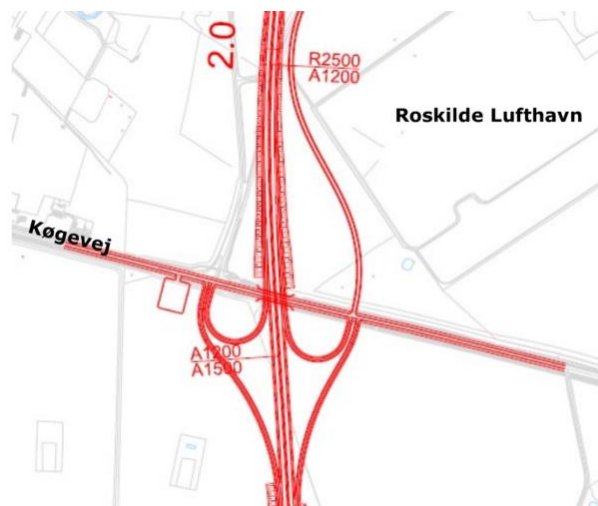
Figur 4-1: Tilslutningsanlæg og forbindelses anlæg ved Køgevej. Kilde: Snit fra tegning 93010-1042

Det bør i projektets næste fase undersøges om der kan anvendes ruderanlæg.