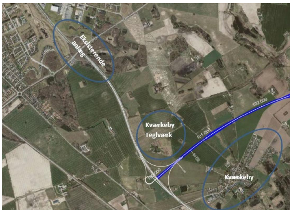
Figur 4-5: Forbindelsesanlæg ved Kværkeby/Vestmotorvejen.

I den vejtekniske rapport for motorvej mellem Ringsted og Roskilde angives : "Normalt anbefales det, at der er en min. afstand på 1,8 – 2,0 km mellem to anlæg, her er det dog kun muligt at opnå en afstand på 1,1 km mellem de to anlæg." Det fremgår også, at anlægget ikke kan placeres længere mod vest pga. Kværkeby Teglværk.